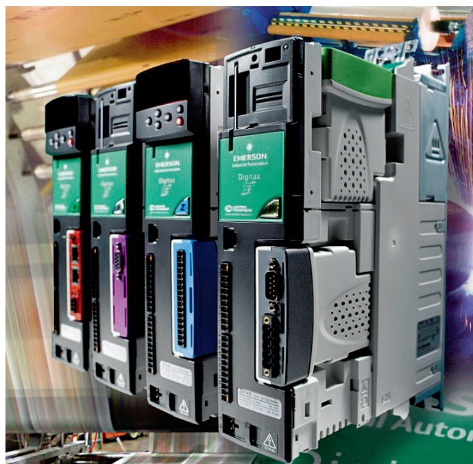
Die Digitax ST-Baureihe umfasst vier Modelle: Base, Indexer, EZ Motion und Plus.

Control Techniques stellt mit Digitax ST auf der SPS/IPC/DRIVES, Halle 1, Stand 440, eine neue extrem kompakte Baureihe von Servoreglern vor, die sich durch hohe Funktionalität mit umfangreichen Anbindungsmöglichkeiten und Rückführungsoptionen auszeichnen. Durch Onboard-Funktionen wie z.B. die Bewegungs- und Automatisierungssteuerung und den «Sicherer-Halt»-Eingang können externe Komponenten eingespart werden.