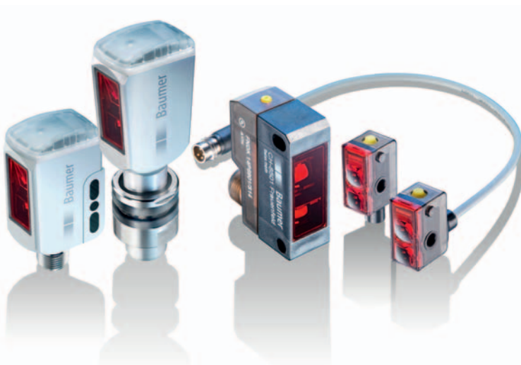
Die SmartReflect-Familie von Baumer.

AMSBIO Bockenheimer Landstr.17/19 60325 Frankfurt/Main Germany Tel.: +49-69-77 90 99 info@amsbio.com AMSBIO Centro Nord-Sud 2E CH-6934 Bioggio-Lugano Switzerland Tel.: +41-91-604-5522 info@amsbio.com