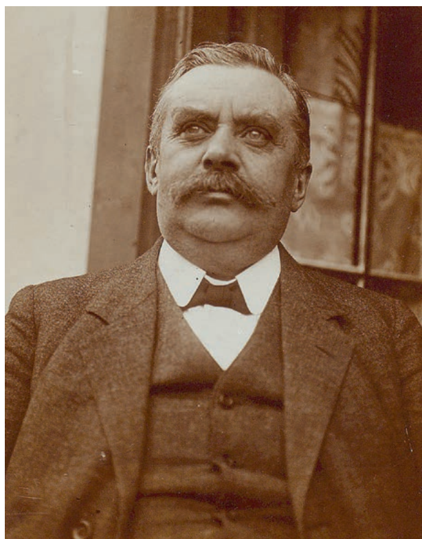
Alfred Werner (1866–1919).