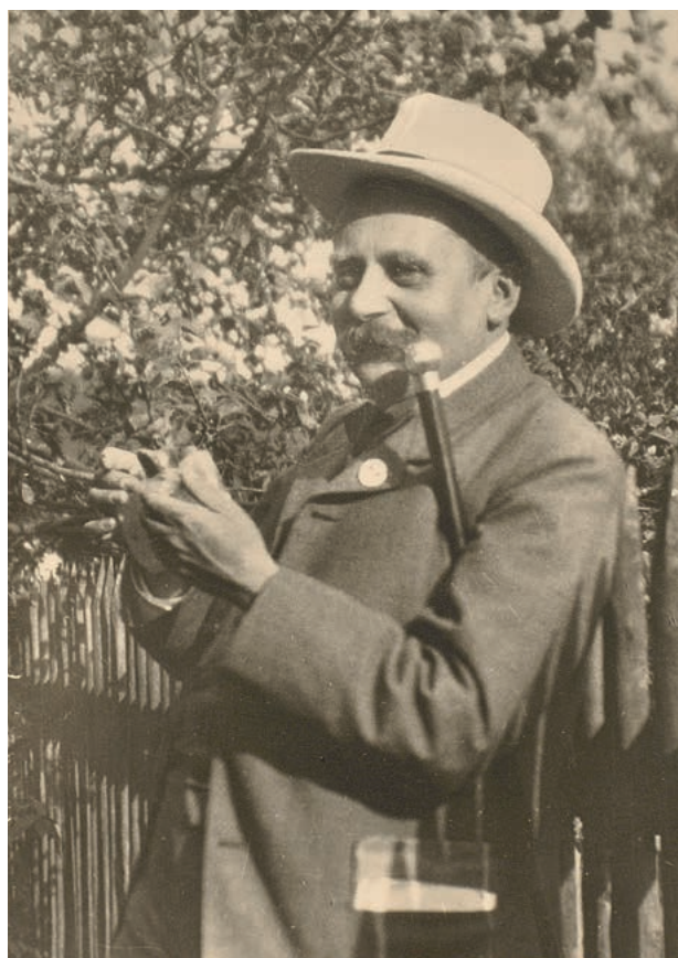
Alfred Werner abseits des Labors. (Datierung unklar, vermutlich vor 1905)

Auch die Kosten wurden damals sehr genau überwacht. In einem Brief an einen Amtmann rechtfertigt Werner den hohen Gasverbrauch von 2464 m 3 monatlich, was 512 Franken